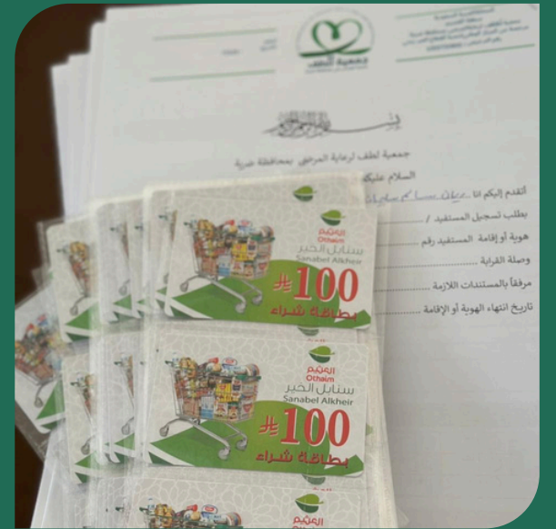
صور من تفعيل برنامج السلة الغذائية