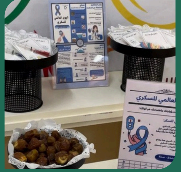
صور من تفعيل اليوم العالمي للسكري